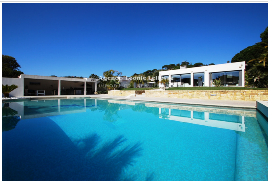
Villa 1885 Sainte-Maxime